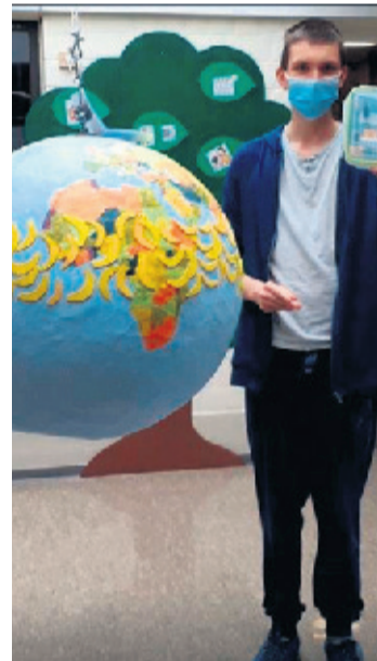
Spielerisch lernen: Das Thema Welt und Umwelt ist ein umfangreiches Thema.

Weitere Informationen zum Wettbewerb gibt es unter www.echtkuh-1.de .